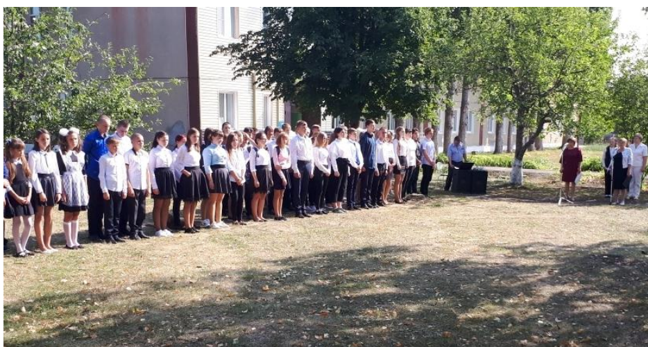
5. Выставка рисунков «Терроризму – НЕТ!» (5-8 кл.).